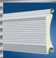
Rolltorprofil ThermoTeck „easy“