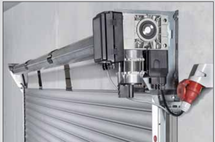
Die vorverdrahtete Steuerung ist in den zuverlässigen Markenantrieb integriert. Die komfortable Bedienung erfolgt über einen steckerfertig vorverdrahteten 3-fach-Taster.

Das neue Teckentrup Rolltorsystem „easy“ zeichnet sich durch eine unkomplizierte und robuste Konstruktion aus. Einzelne Bauteile wurden intelligent vereinfacht und optimal aufeinander abgestimmt. Aufwändige Aufmessarbeiten, z.B. für die Konsolenbefestigung und Wickelwellenposition, entfallen. Zusätzlich wird der Einbau durch die Vorverdrahtung von Steuerung und Antrieb erleichtert. Im Vergleich zu herkömmlichen Toranlagen können so bis zu 40% Montagezeit eingespart werden.