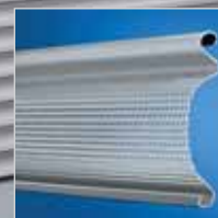
Rolltorprofil 6010 visio „easy“