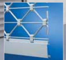
Rollgitter TG-X „easy“