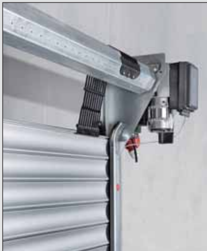
Langlebiges und hochfestes Anbindungssystem zwischen Welle und Torpanzer (Teckentrup Schutzrecht). Die 8-Kant-Wickelwelle inkl. Lagerzapfen ist vollständig verzinkt.