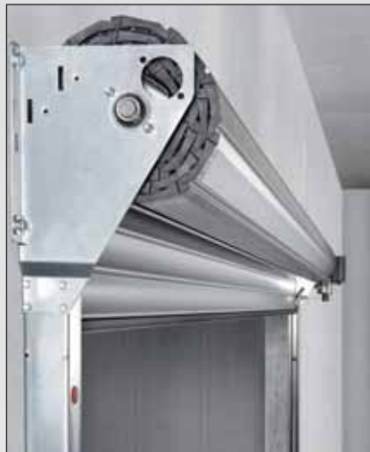
Der Rolltorpanzer ist auf der Wickelwelle vormontiert und kann problemlos in die Konsole eingebaut werden. Die platzsparende Konsole ist mit der Führungsschiene verschraubt – aufwändiges Aufmessen und Anzeichnen kann so entfallen.