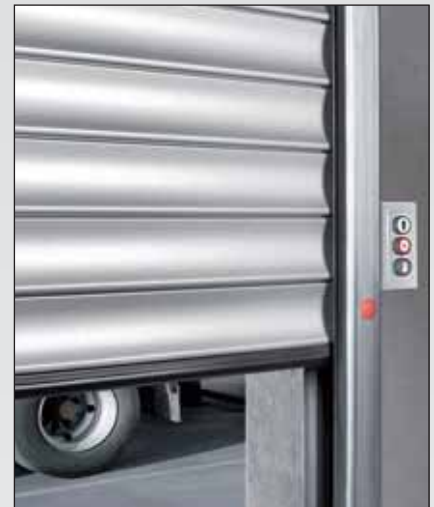
Vorgelochte Führungsschienen erleichtern die Montage. Die Bodendichtung ist in das letzte Profil integriert und sorgt so für eine harmonische Optik innen und außen.